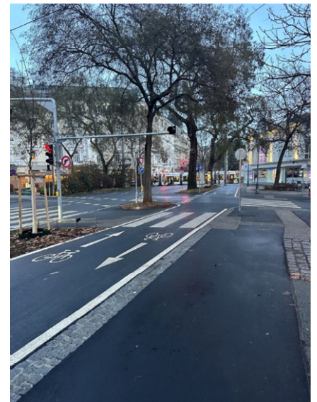
Übergang beim Eisernen Tor

Daher stelle ich namens des (Korruptions-) Freien Gemeinderatsklubs nachfolgenden